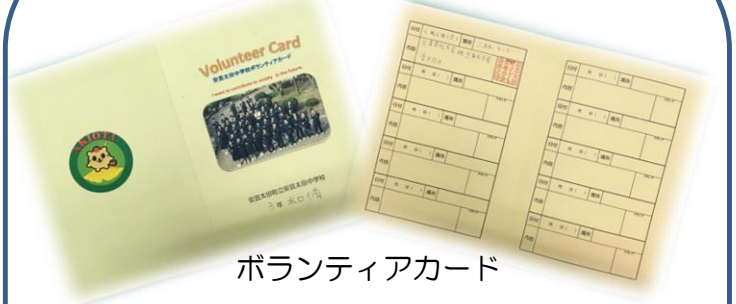
ボランティアカード

I want to contribute to society in the future.