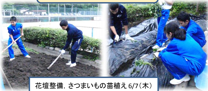
花壇整備, さつまいもの苗植え 6/7(木)

みんなで楽しめる学校づくり・・・ 秋には、健全委員会とタイアップして、焼き芋大会を行う予定です。