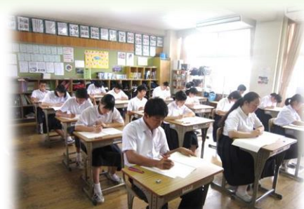
6/14(木)・15(金)3年実力テスト <実力把握...課題チェック>