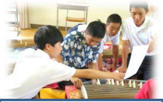
ハワイの高校生との交流

そこで、本校では次のような基本構想に基づき、平成30年度の教育を推進しています。