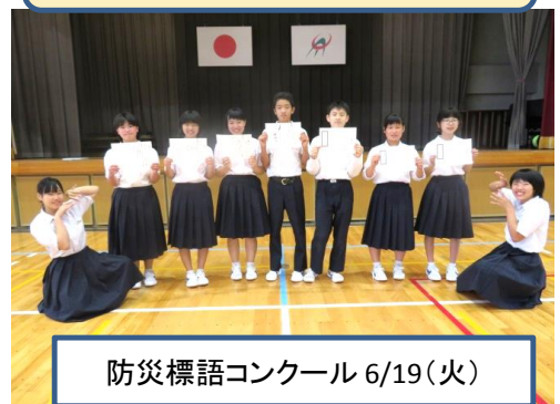
防災標語コンクール 6/19(火)