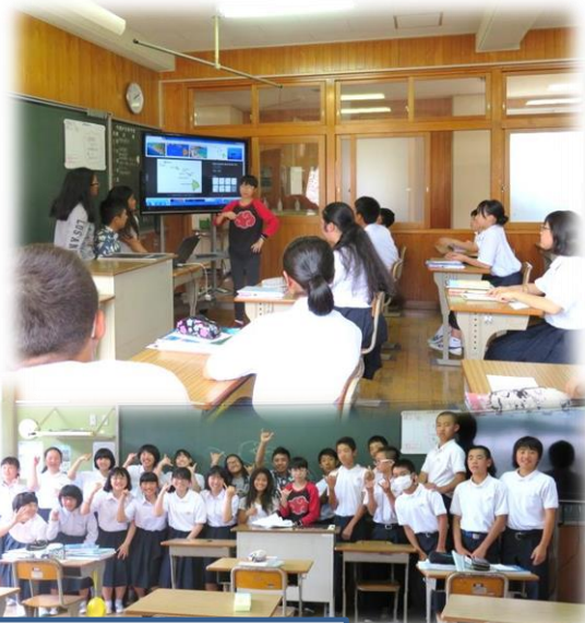
3年 互いの文化理解...安芸太田町紹介