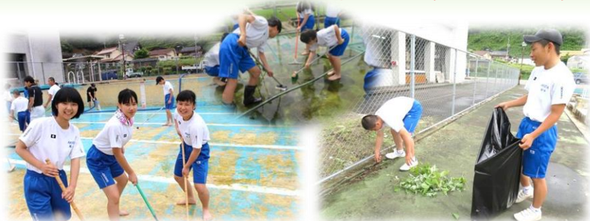
6/12(火)筒賀プール清掃<地域貢献活動>