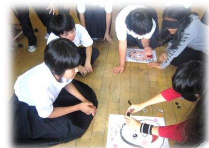
1年 日本の遊び...福笑い・けん玉