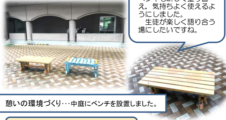
憩いの環境づくり・・・中庭にベンチを設置しました。

みんなで楽しめる学校づくり・・・ 秋には、健全委員会とタイアップして、焼き芋大会を行う予定です。