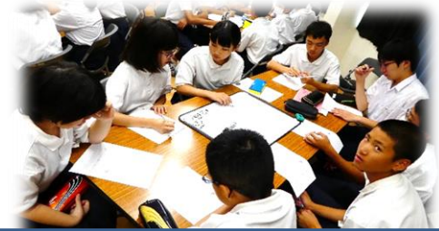
班別事例研修・・・安芸太田町の災害や災害時の行動について