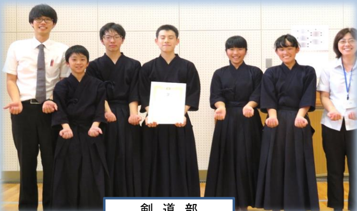
剣 道 部