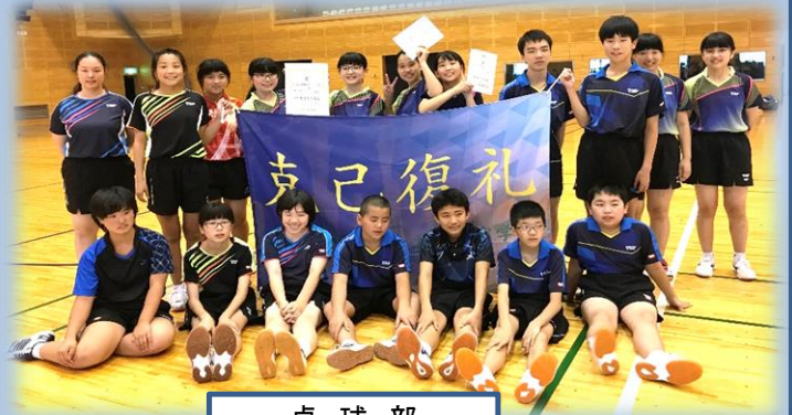
卓 球 部

ぜひ、上位まで勝ち抜いて賞をとってください。悔いを残さないような試合をしてください。