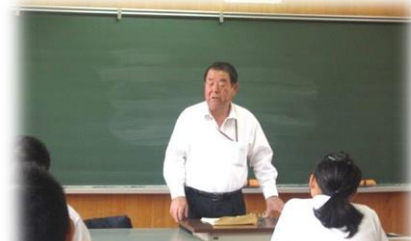
働くこと・・・人のつながり・礼節を大切に！