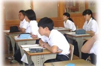
8/20～8/24 職場体験学習の事前学習 「勤労観・職業観の育成、働くことの意味を考える」