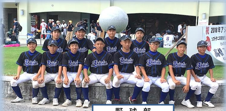
野 球 部