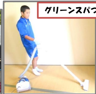
グリーンスパツツが

町内の各職場・事業所で働く2年生の姿は、普段の学校生活とは違って生き生きとしており、とても新鮮でした。この体験学習で、働くことの大変さや楽しさを体感することができたのではないのでしょうか。多くの職場から「生徒が自分から動いていたので助かった」というお言葉をいただきました。自分たちで考えて行動することができていたことがわかり、嬉しく思いました。自主的に動けたことを2学期以降の様々な活動に生かして行ってほしいと思います。5日間お世話になった職場の皆様、本当にありがとうございました。〈2年担任〉