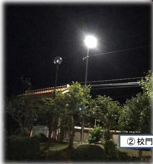
② 校門横に街路灯設置