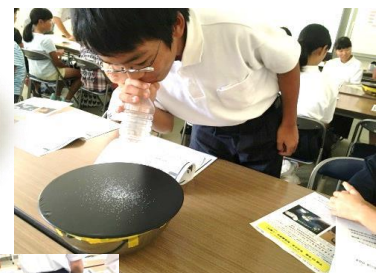
音が出る仕組み 音が出るものは、いろいろ たとえば、水鼓(たいこ)