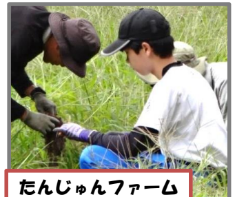
たんじゅんファーム