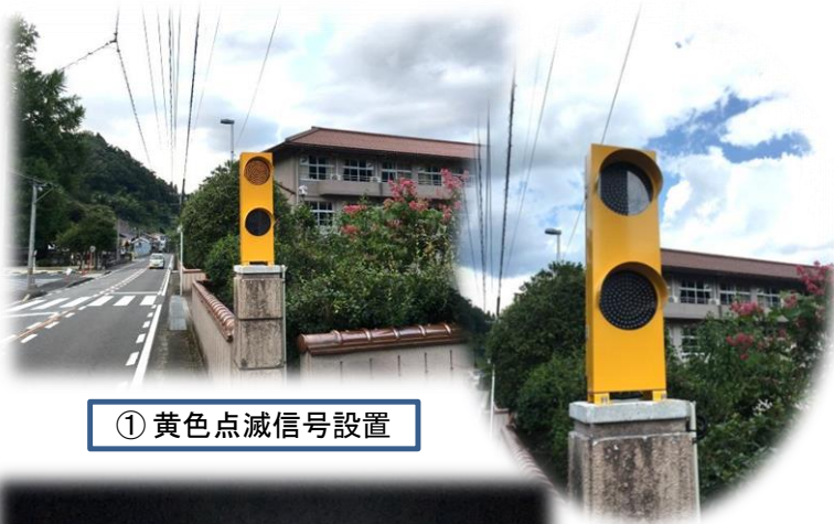
① 黄色点滅信号設置