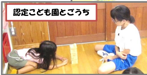
認定こども園とごうち