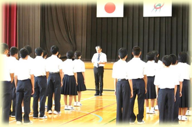
8月27日(月) 第2学期始業式 ～校長式辞の様子

今年の夏は大変な猛暑となりました。同じ町内の加計では、観測史上最高の38.8度を記録し、全国の観測地点では三カ所で41度を超えました。これからは昼と夜の気温差が大きくなりますので体調管理には十分気をつけてもらいたいと思います。