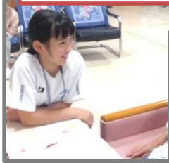
介護事業所ふれあい