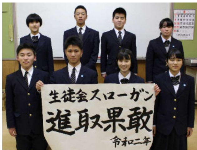
新生徒会執行部のメンバー