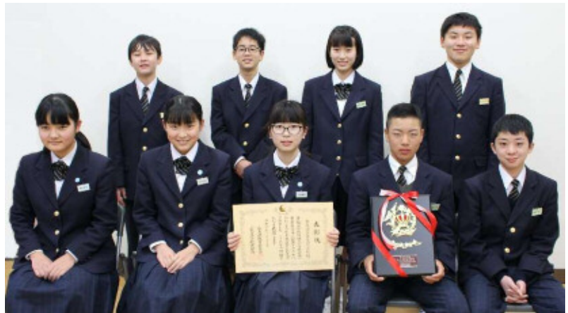
生徒会として防災教育の推進を担った健全委員会のメンバー

この度、安芸太田中学校が令和元年度広島県学校安全表彰を受賞しました。これは、本校の防災の基盤となる「つながり」づくり、地域の防災の専門家やリーダーとの積極的な連携や授業づくりなどの取組が高く評価されたものです。